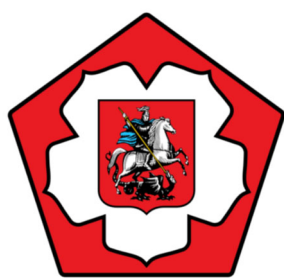
ФЕДЕРАЦИЯ ДЗЮДО МОСКВЫ